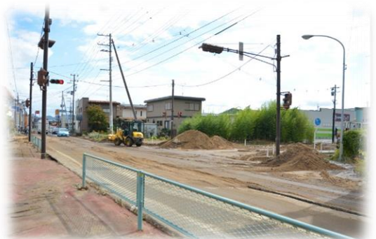
被災当時の町並み