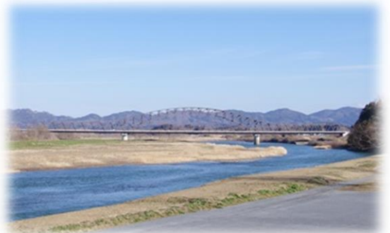
阿武隈川沿いにのどかさが戻りました