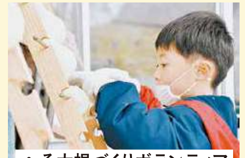
へそ大根づくりボランティア

冬の寒さと天日で大根の旨みを凝縮する伝統の保存食。地域の方々と一緒にへそ大根づくりのお手伝いができます。へそ大根作りを通して、筆甫地区の豊かな自然と伝統の食文化に触れてみてください!