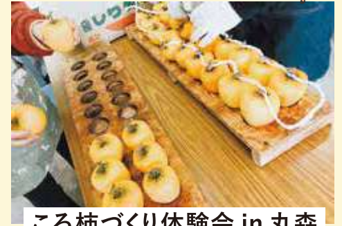
ころ柿づくり体験会 in 丸森

ころ柿のカーテンは丸森町の初冬の風物詩です。農家直伝のころ柿(干し柿)づくりの体験会です。集中して皮をむくのが楽しい、とりピーター続出。2ヶ月後の1月には綺麗でフワフワのころ柿がご自宅へ届きます。