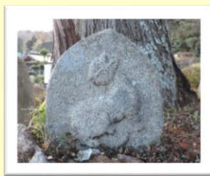
瑞雲寺参道側(金山)