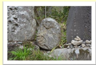
愛教院参道側(丸森)